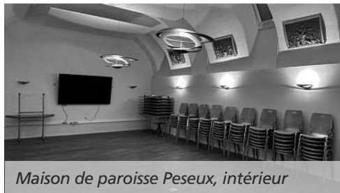
Maison de paroisse Peseux, intérieur

Lorsqu'en 2017 le pasteur résidant dans l'appartement de notre Maison de paroisse de Peseux annonça son prochain départ, le Conseil paroissial de la Côte saisit l'occasion pour lancer une réflexion de fond sur l'avenir de ce bâtiment. En effet sa dernière rénovation datait de plus de cinquante ans, et la configuration des locaux ne répondait plus de manière rationnelle aux attentes actuelles. Il apparut rapidement que les volumes généreux du