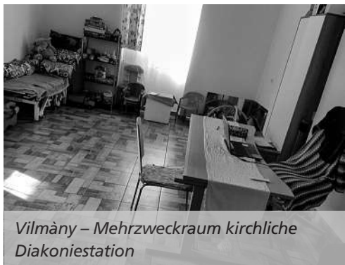
Vilmány – Mehrzweckraum kirchliche Diakoniestation

1) Im alten Pfarrhaus der reformierten Ortsgemeinde Im ostungarischen Dorf Vilmány mit CHF 10'000 den Aufbau und die Einrichtung einer kirchlichen Diakoniestation mit Ambulatorium für Ärztin und Zahnarzt inkl. einem Waschsalon, Kleiderkammer,