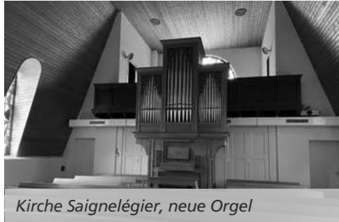
Kirche Saignelégier, neue Orgel

der Erneuerung der Galerie und der Integration der neuen Orgel in dieselbe. Aufgrund geringer Eigenmittel startete die Kirchengemeinde daher eine Spendenaktion, um dieses nicht nur für die Pfarrei sinnvolle Projekt, sondern das auch aus denkmalgeschützter, architektonischer und kultureller Sicht wertvolles Konzept zu finanzieren. Dank