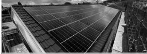
Solaranlage Kirchenzentrum Düdingen

Aus der Überzeugung, dass wir unsere Verantwortung bezüglich der Bewahrung der Schöpfung wahrnehmen wollen, haben wir uns im 2022 intensiv mit der Planung der energetischen Sanierung unseres Kirchenzentrums beschäftigt. Die alte